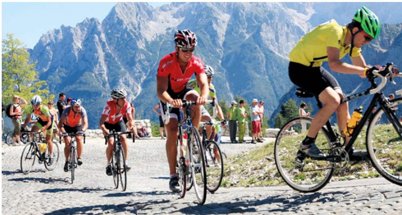
Juriš na Vršič

Ker vemo, da zgledi vlečejo - kakšen je odnos odraslih do vsakodnevni aktivnosti znotraj občinskih meja? Groba ocena, seveda.