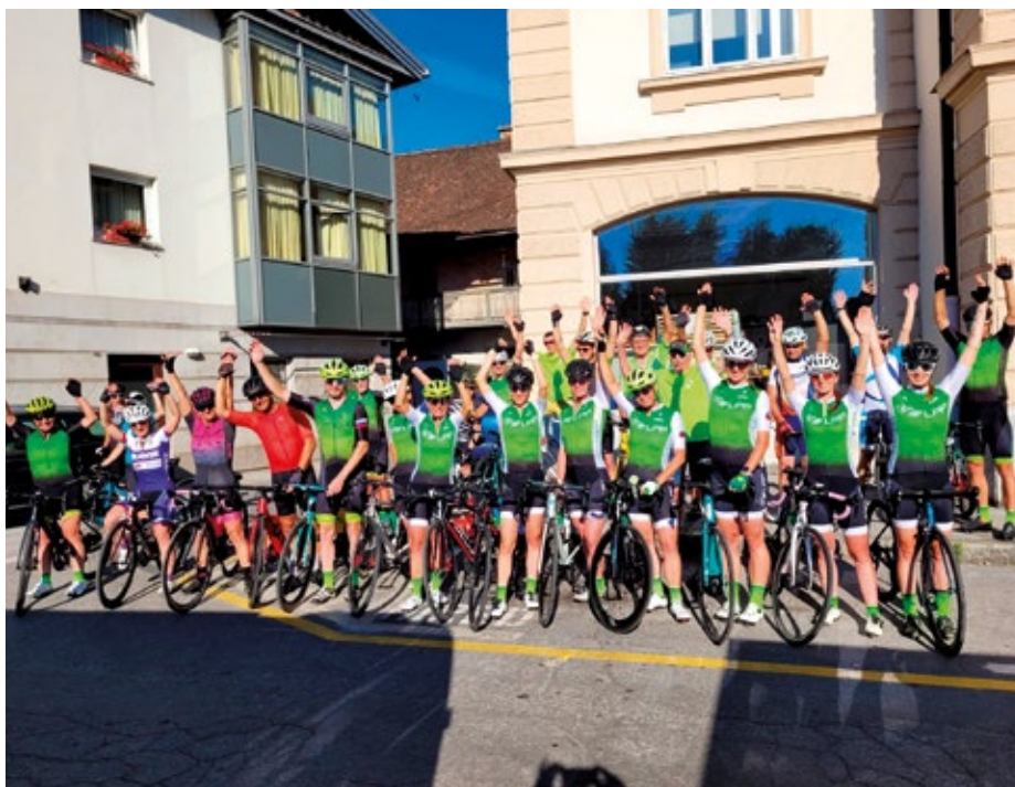
Dobrodelno kolesarjenje s podporniki akcije

Priprave na projekt so potekale že vse od februarja, ko so začele padati prve ideje, da bi projekt dobro zaživel. Dekleta smo se vse od marca dalje pripravljale na ženskih rundah. Zbirališče kolesark je bilo vedno vsak torek na parkirišču pokopališča v Vodicih. A na rundah nismo urile le kolesarskih kilometrov, ampak smo si izmenjavale ideje projekta, si razporejale delo in tako delovale kot ena popolna celota. Kaj hitro se je izkazalo, da projekta ne bomo zmogle same, saj smo si zastavile cilj, opremiti poro-