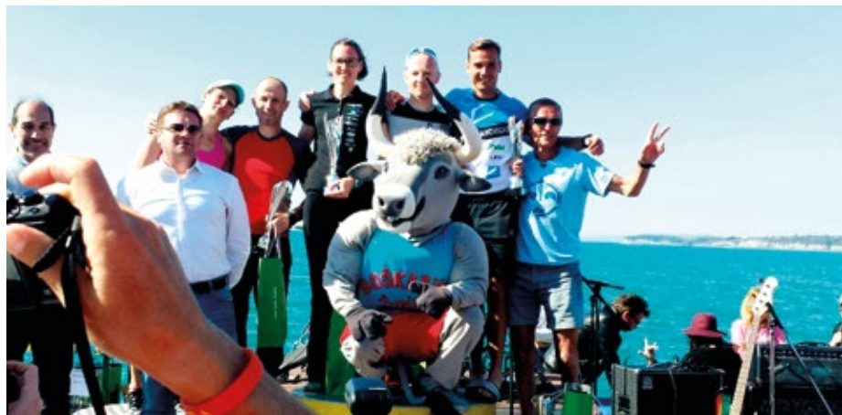
Šport povezuje! Istrski maraton

Kljub dopustu skoraj ni dneva, da ne bi pomislil tudi na službene obveznosti. Mimoregredsko skozi različne aktivnosti prihajajo nove zamisli za delo v prihodnjem šolskem letu. Načrtovanje dnevnih dejavnosti, kot so športni dnevi, posebej planinski športni dan, največkrat poteka med počitnicami.