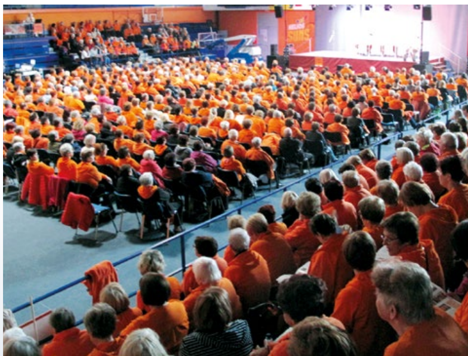
Množični zbor članov Šole zdravja v Domžalah

Slovenije. Vadijo zunaj, na svežem zraku, na varni razdalji in ne uporabljajo nobenih pripomočkov. V času epidemije se hitro prilagodijo in redno jutranjo vadbo organizirajo preko aplikacije Zoom. Za vse tiste, ki dostopa do interneta nimajo, pa omogočijo spremljanje vadbe »1000 gibov« preko malih ekranov. V času epidemije so namreč naredili velik korak naprej, saj so združili moči z lokalnimi televizijami in s filmom Društva Šola zdravja »Metoda 1000 gibov« motivirali veliko število prebivalcev, da začnejo vsakodnevno skrbeti za svoje zdravje. Društvo Šola zdravja se lahko pohvali s primerom dobre preventivne prakse, pri čemer ga že šesto leto podpira tudi Ministrstvo za zdravje, ki je prepoznalo njihovo poslanstvo – skrb za ohranjanje in izboljševanje zdravja prebivalcev.