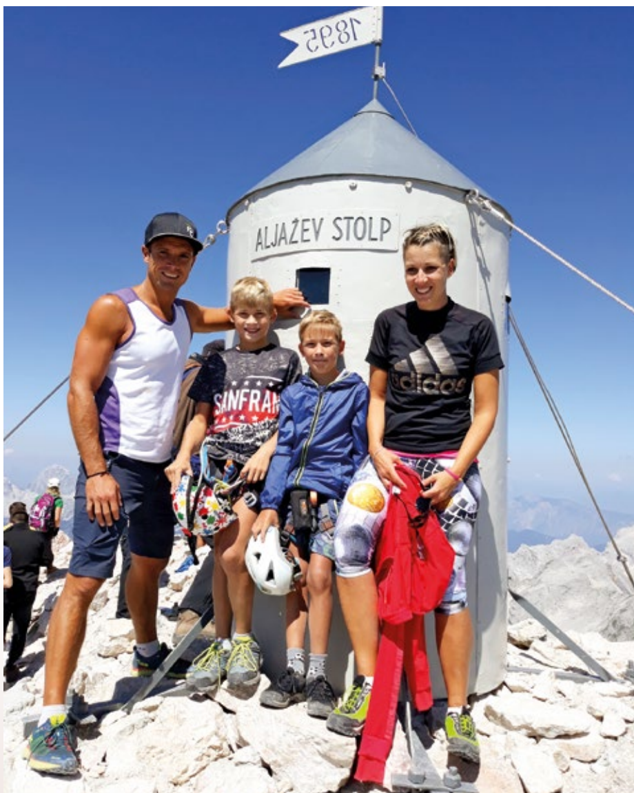
Seveda je bil osvojen tudi Triglav